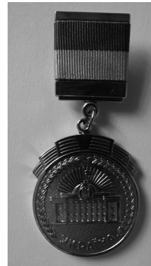
Нагрудний знак до Почесної грамоти Верховної Ради України (2023)