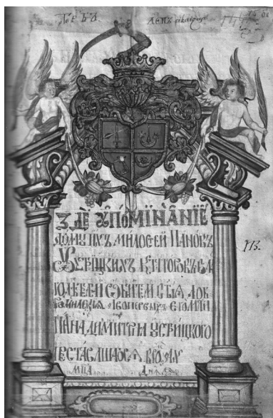
Пом'яник Добромильського монастиря. 1665–1762 рр. МВ 1261, арк. 75