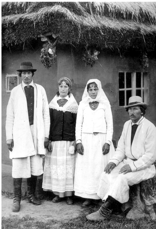
Народний одяг, район Мостиська. Етнографічна виставка в Тернополі 6 липня 1887 р. Fotog. Alfred Silkiewicz w Tarnopolu, [1887]

Фонд фотографій Відділення «Палац мистецтв імені Тетяни та Омеляна Антоновичів» Львівської національної наукової бібліотеки України імені В. Стефаника становить важливу документальну, мистецьку та інформаційну цінність. Наукове опрацювання фонду дасть можливість широко використовувати його для історичних, мистецтвознавчих, літературознавчих досліджень, укладання каталогів і покажчиків, організації виставок.