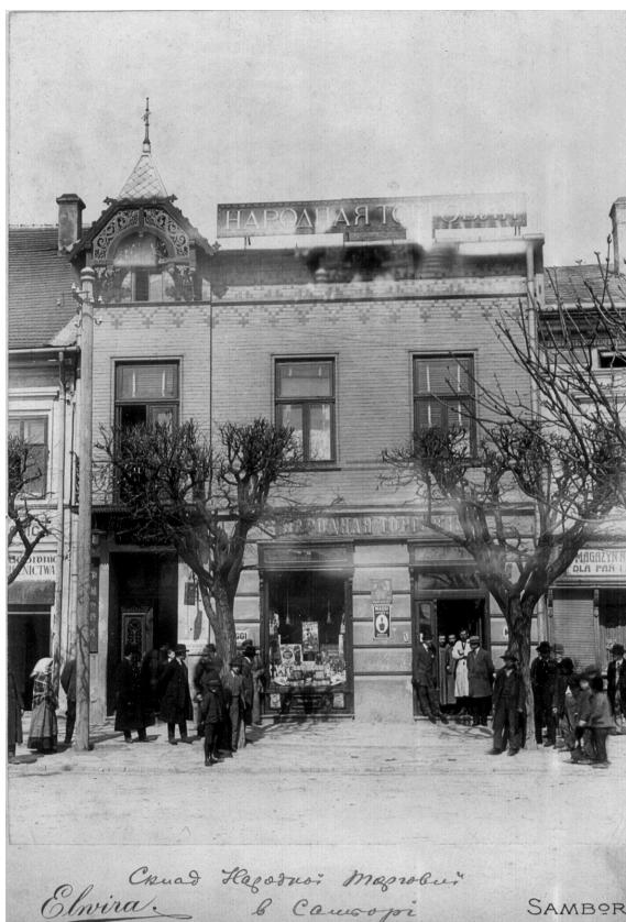
Склад Народної Торгівлі в Самборі. Zakład artystyczno fotograficzny Elwira w Samborze, [поч. XX ст.]